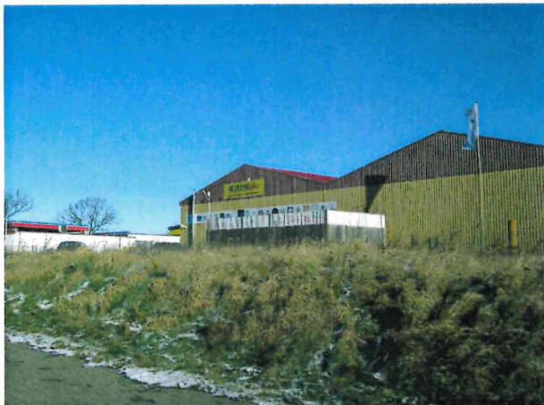
Getränkemarkt im nördlichen Teilbereich

Der Gebäudebestand besteht zum überwiegenden Teil aus eingeschossigen Hallen. Jedoch sind einige zweigeschossige Gebäudeteile und ein vollständig zweigeschossiges Verwaltungs- und Wohngebäude vorhanden. Beispielsweise ist der Ausstellungs- und Bürotrakt der Tischlerei im südlichen Teilbereich zweigeschossig, während der Hauptgebäudeteil nur ein Vollgeschoss aufweist. Die südöstlich der Erschließungsstraße gelegenen Baufelder sind bisher gänzlich unbebaut.