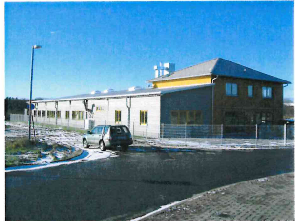
Tischlerei im südlichen Teilbereich