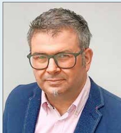
Veikko Hackendahl Stadtvertretervorsteher