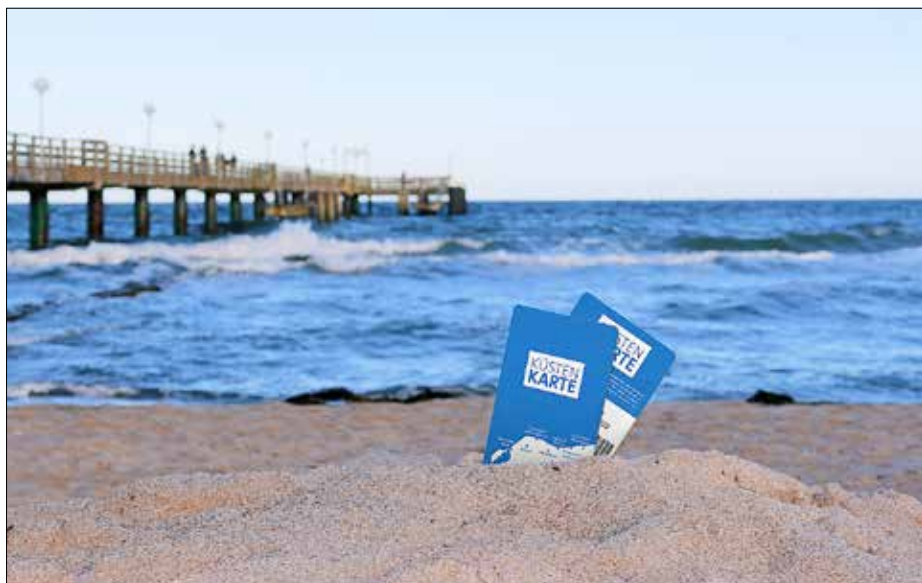
KÜSTEN KARTE der neuen Tourismusregion an der Ostseeküste Mecklenburg

Die Anerkennung von Tourismusorten und Tourismusregionen gehört zu den Aufgaben des Ministeriums für Wirtschaft, Infrastruktur, Tourismus und Arbeit. Mit der neuen Tourismusregion an der Ostseeküste Mecklenburg hat sich – neben der Insel Usedom und Stadt Wolgast, Mönchgut-Granitz (Rügen) sowie der Mecklenburgischen Schweiz – die vierte Tourismusregion in Mecklenburg-Vorpommern gebildet.